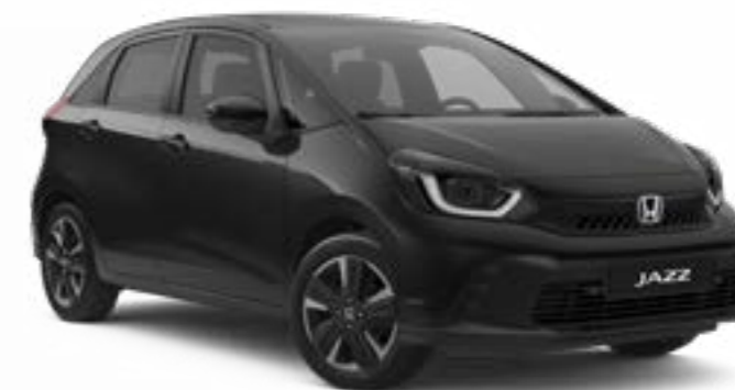
Cristal Noir Perle