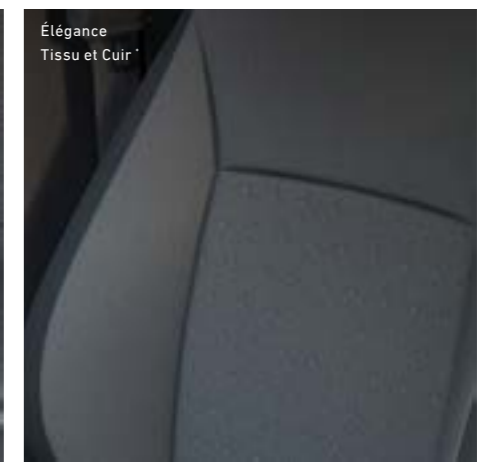
Élégance Tissu et Cuir *