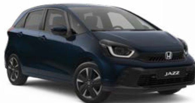
Faisceau Bleu Nuit