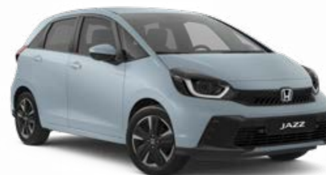
Perle de Brume du Fjord