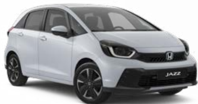
Opale Blanc Argent

Nous avons créé une large gamme de couleurs parfaitement adaptées à l'élégante nouvelle Jazz, complétées par notre sélection de revêtements de haute qualité.