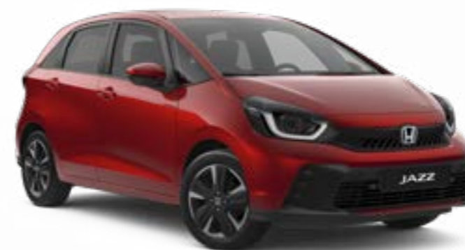
Rouge Cristal Haut de Gamme